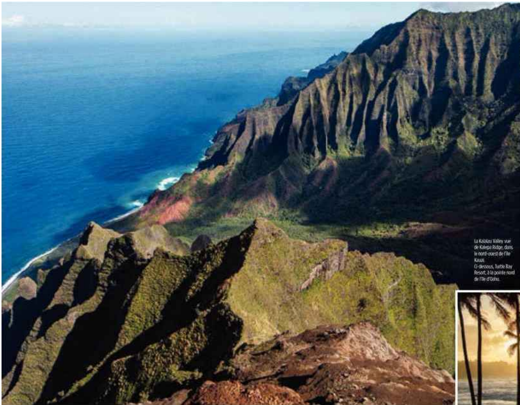
La Koolau Valley vue de Koolau Ridge, dans le nord-ouest de l'île Koolau. (En dessous, l'île Bay Resort, à la pointe nord de l'île d'Oahu.)