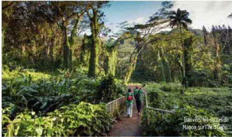
Trail vers les chutes de Manoa, sur l'île d'Oahu.