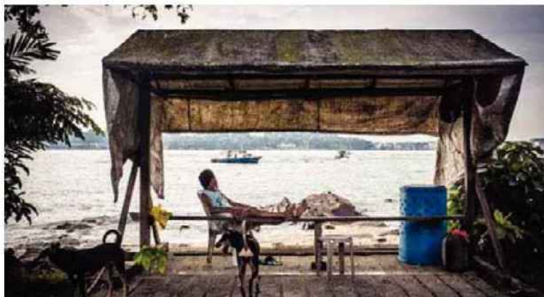
Une centaine d'habitants vivent sur Pulau Ubin sans eau courante, ni électricité.

Bollywoodveggies, le jardin portager bio, 100 Neo Tiew Road Singapore 719026 (Kranji). www.Bollywoodveggies.com