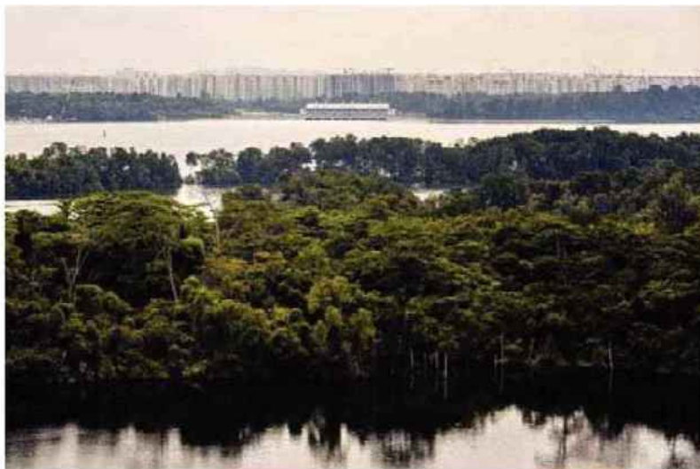
L'île de Pulau Ubin, à quinze minutes de bateau de Singapour. Un autre monde.

– disparue en 1914, elle est devenue au fil des ans une sorte de déesse vénérée par les Chinois. Promenade dans la mangrove, paradis des varans, des tortues, des serpents et des guépiers à queue d'azur. Ce lieu de nature est un havre de paix. Comme la réserve de Sungei Buloh qui fait face à la Malaisie. Terre d'adoption des hérons, des martins-pêcheurs et des crocodiles, ses 200 hectares de forêts luxuriantes qui barbotent les pieds dans la mer semblent rêver loin du monde.