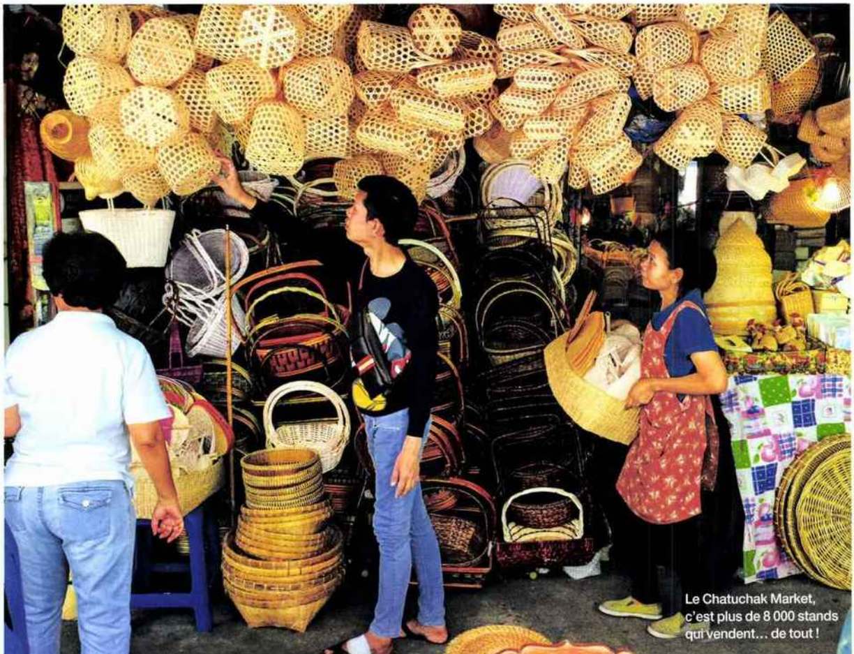
Le Chatuchak Market, c'est plus de 8 000 stands qui vendent... de tout !