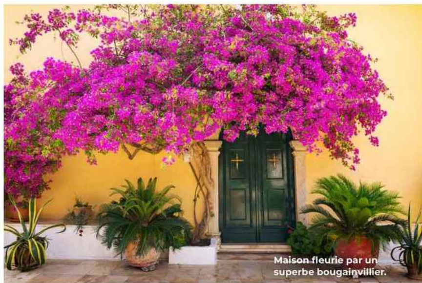
Maison fleurie par un superbe bougainvillier.

C orfou affiche des mensurations idéales pour en apprécier toutes les beautés lors d'un court séjour. Néanmoins, elle est assez grande pour offrir de multiples recoins à découvrir. Aux confins de l'Albanie, de la Grèce et de l'Italie, cette île mythique à l'histoire plurimillénaire appelle au farniente comme aux excursions, au fil de ses sites historiques, de ses paysages alternant montagnes et criques cachées, de ses plaines semées d'orangers, de cyprès et d'oliviers. Tel un splendide tableau impressionniste, ses couleurs se font tendres et l'âpreté de son relief s'adoucit des reflets bleutés de la mer.