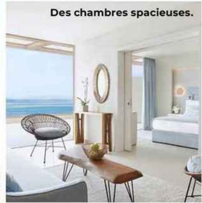
Des chambres spacieuses.

pour un séjour de 5 nuits minimum. Ikosresorts.com . Oovatu propose également une formule en tout inclus, dès 1629 €/pers. le séjour de 7 nuits. Oovatu.com .