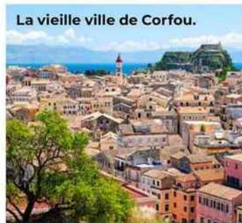
La vieille ville de Corfou.