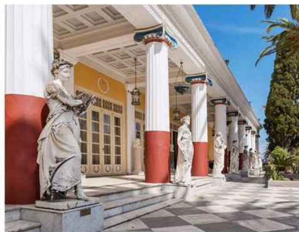
A Gastouri, le palais néoclassique de style pompéien, édifié pour l'impératrice Sissi, est dédié au héros homérique Achille.