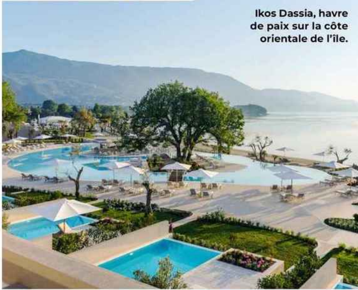
Ikos Dassia, havre de paix sur la côte orientale de l'île.