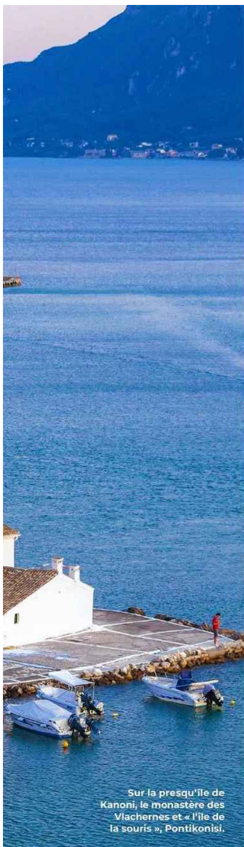
Sur la presqu'île de Kanoni, le monastère des Vlachernes et « l'île de la souris », Pontikonisi.