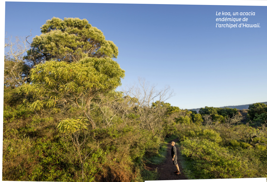
Le koa, un acacia endémique de l'archipel d'Hawaïi.