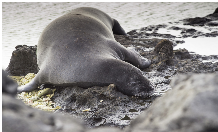
Le phoque moine d'Hawaï, dans ses quartiers de basalte, dans la réserve de Ka'ena Point, sur Oahu.

Pour tenter d'apercevoir l'un des derniers trésors d'Oahu, il faut se rendre dans l'ouest de l'île, à la réserve de Ka'ena Point, retranchée à l'extrémité d'une péninsule. Derrière une barrière qui ne laisse passer que les randonneurs, une piste jalonnée par les longues hampes florales des agaves longe une mer en ébullition. Les yeux s'usent en vain à chercher un aileron ou une caudale de kohola , la baleine à bosse qui s'attarde dans la région entre décembre et mai pour y élever ses jeunes. Après trois quarts d'heure d'une marche soutenue, on parvient aux portes d'une clôture installée en 2011 pour protéger les oiseaux de mer des chiens, chats, rats et mangoustes, les uns étant amateurs d'œufs frais, les autres de volailles faciles à plumer. Les albatros de Laysan, qui