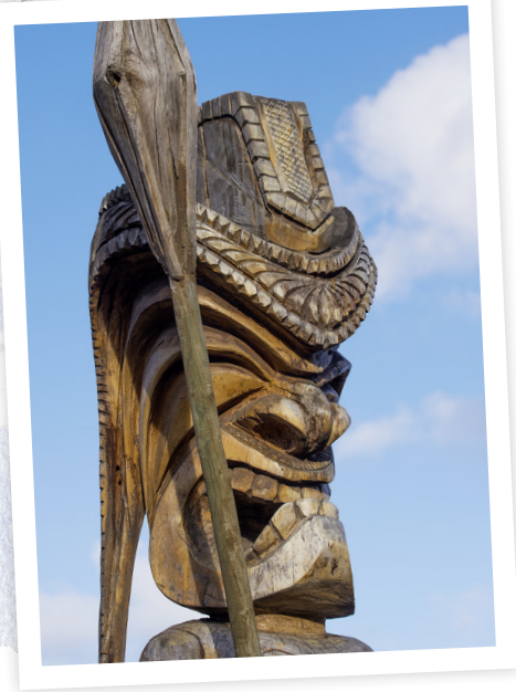
Hawaii ne se réduit pas au surf et aux cocotiers... Sur Kauai, des murailles sauvages plantent un décor grandiose (ci-dessus). Sur Oahu, on peut s'imprégner de culture polynésienne (ci-contre).