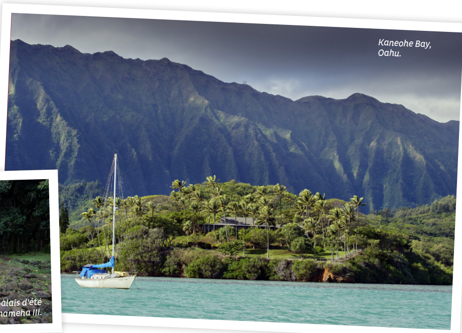
Kaneohe Bay, Oahu.

♦ jardins. Même constat chez les oiseaux: ce couple de shamas à croupion blanc sautillant dans le sous-bois ou ce charmant léiothrix jaune furetant sous les feuilles mortes descendent d'individus échappés de volières dans les années 1930-1940.