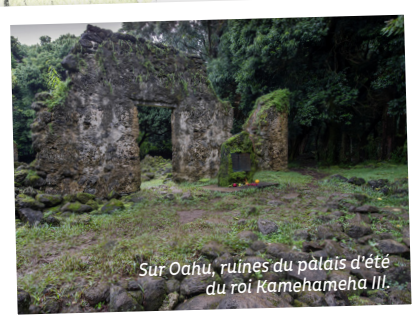
Sur Oahu, ruines du palais d'été du roi Kamehameha III.