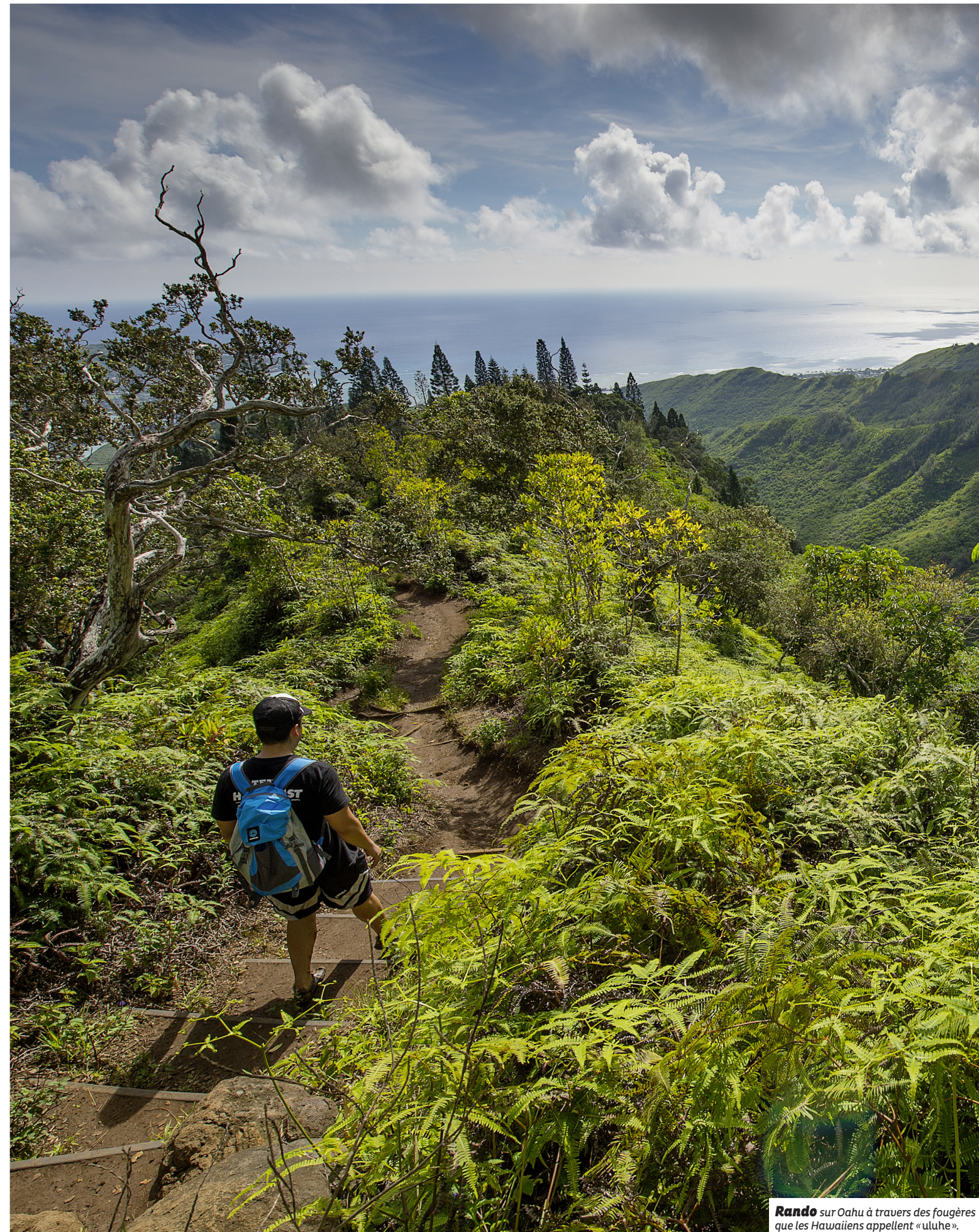
Rando sur Oahu à travers des fougères que les Hawaïens appellent « uluhe ».