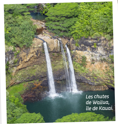
Les chutes de Wailua, île de Kauai.