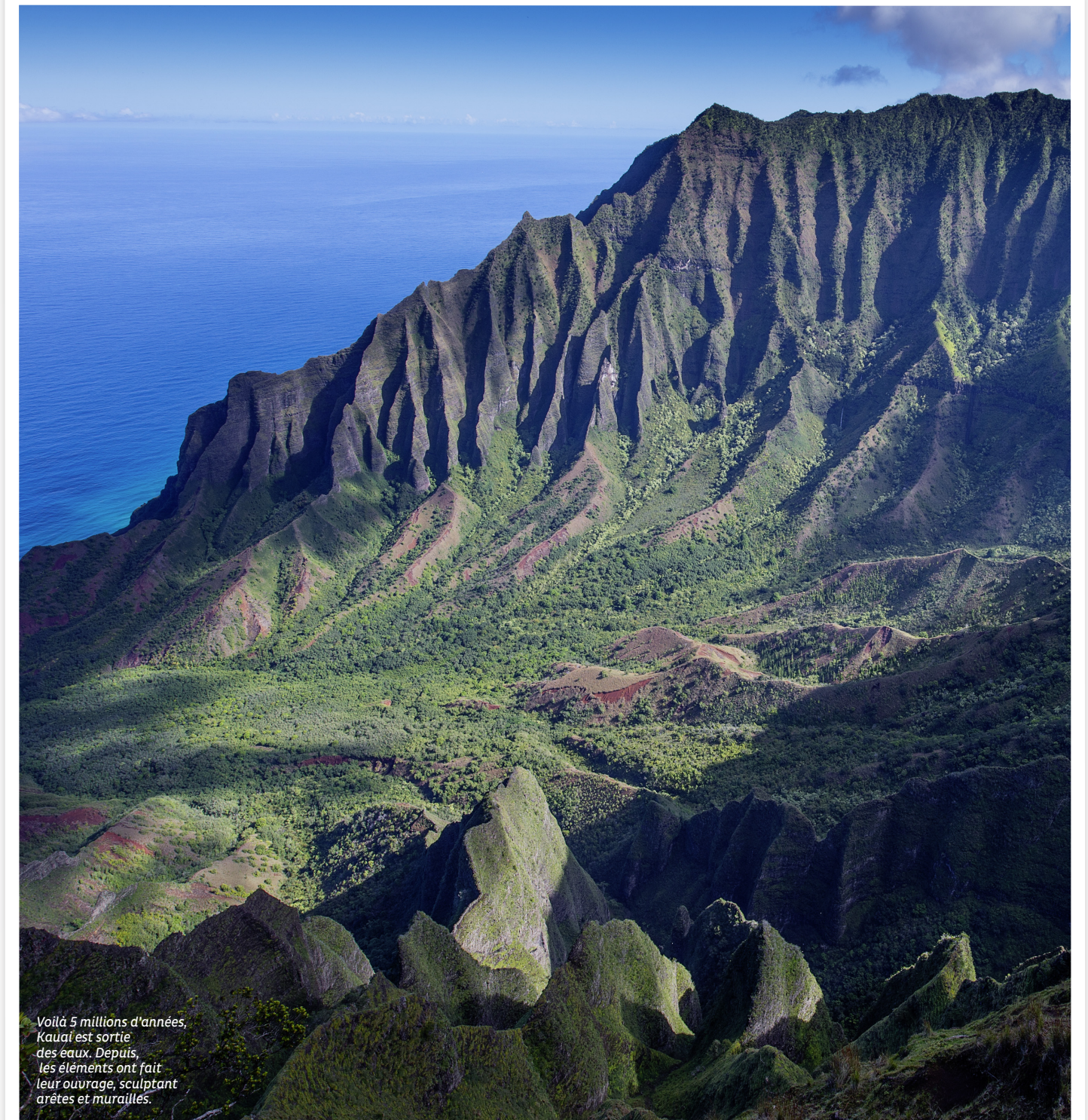
Voilà 5 millions d'années, Kauai est sortie des eaux. Depuis, les éléments ont fait leur ouvrage, sculptant arêtes et murailles.

Au loin, le soleil frappe sur la mer. Sous nos pieds, la vallée de Kalalau étale une luxuriance de jardin d'Éden. « Pendant longtemps, Kalalau a été habitée par les Hawaïiens, explique Patrick. Il y avait même un ranch jusque dans les années 1960. Aujourd'hui, des communautés de hippies s'y sont installées en toute illégalité et y mènent une vie quasi autarcique! » On se verrait bien jeter son short pour rejoindre ces hédonistes et vivre tout nu en cultivant des patates douces loin de Google et du CAC 40. Dommage qu'il y ait ces satanés moustiques... ➔