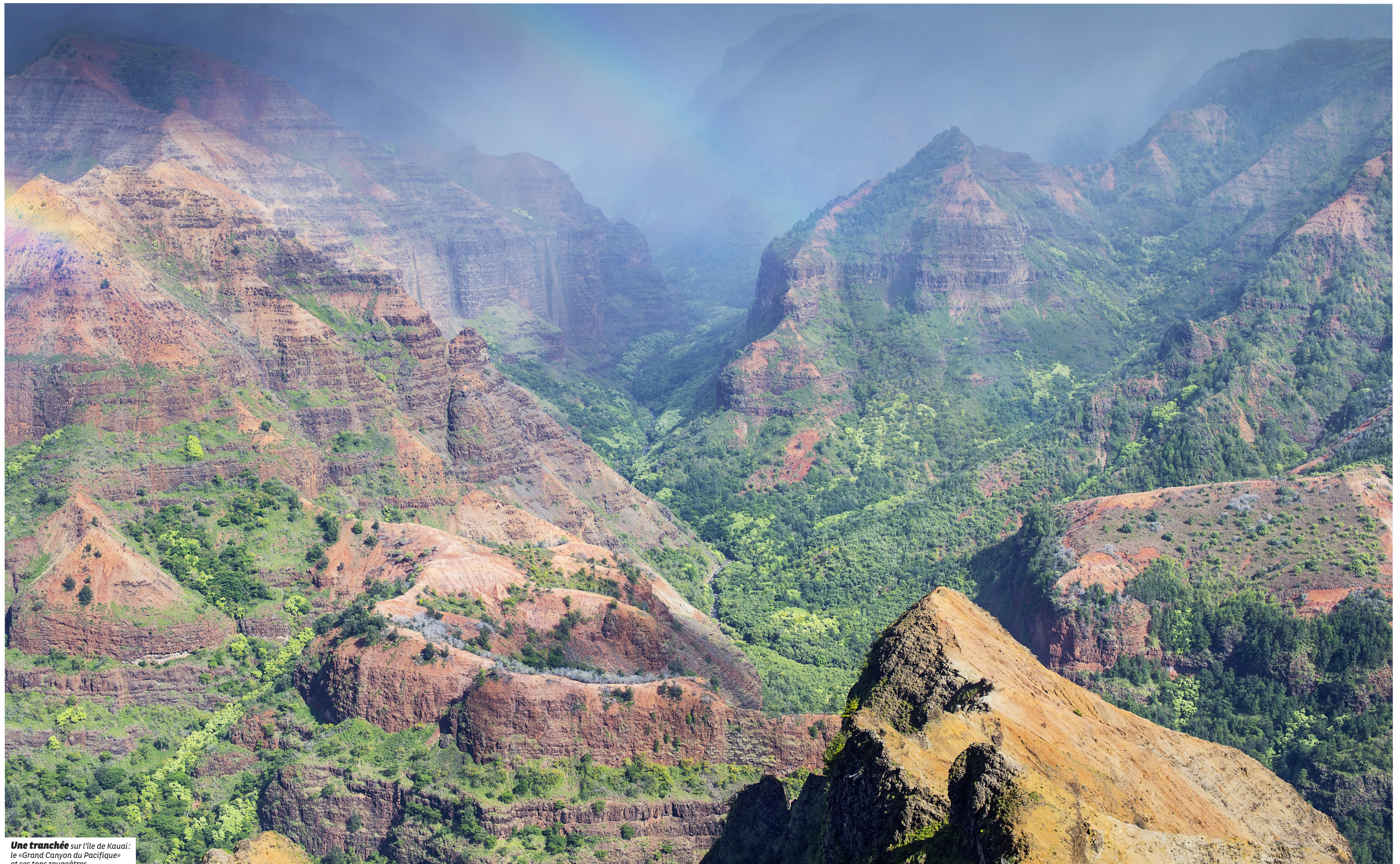
Une tranchée sur l'île de Kauai : le «Grand Canyon du Pacifique» et ses tons rougeâtres.